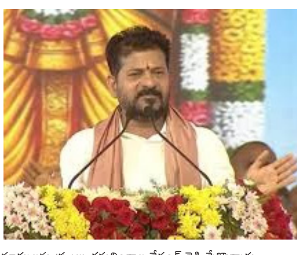
మార్పులను ప్రజలు గమనించాలి రేవంత్ రెడ్డి పేర్కొన్నారు.