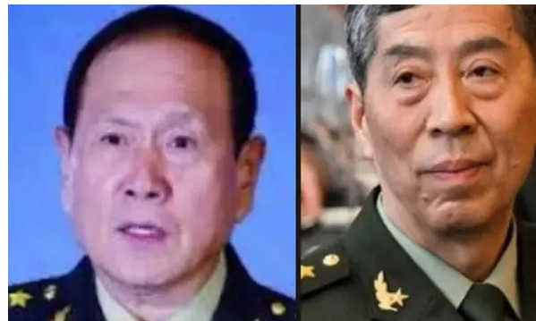
అనేక ప్రచారంతో జిన్ పింగ్ ప్రభుత్వంపై ప్రజల్లో నమ్మకం పెరిగింది. అయితే దేశాధ్యక్షుడు జిన్ పింగ్ తో లి షాంగ్ పూర్తిగా, వి ఫాంగ్ మధ్య ఏవైనా బీదాలు ఉన్నాయో లేదో తెలియదు.

బీజింగ్: చైనా రక్షణ మంత్రులుగా చేసిన ఇద్దరికీ భారీ శిక్ష వేసింది కోర్టు. గతంలో రక్షణ మంత్రులుగా చేసిన వి ఫాంగ్, లి షాంగ్. మరణ శిక్ష విధించింది. అయితే రెండేళ్ల సమయంలో ఎటువంటి అపరాధానికి పాల్పడకుంటే, వారికి జీవితకాల శిక్ష వర్తించనున్నది. అవినీతి కేసులో మిలిటరీ కోర్టు ఈ శిక్షను ఖరారు చేసింది. ఇద్దరు మంత్రులు గతంలో లంచాలు తీసుకున్నట్లు ఆరోపణలు ఉన్నాయి. లి షాంగ్ పూర్తిగా లంచాలు ఇచ్చినట్లు ఆరోపణలు ఉన్నాయి. చైనా అధ్యక్షుడు జీ జిన్ పింగ్ 2014 నుంచి అవినీతికి వ్యతిరేకంగా పోరాడుతున్నారని, సీనియర్ మిలిటరీ, పాలిటికల్ అఫీ షి యుల్స్ ను అయన టార్గెట్ చేస్తున్నారు. ఆ అపరేషన్ లో భాగంగా అనేక మంది హై ర్యాంక్ అఫీసర్లు, మిలిటరీ నేతల్ని కోల్పోవాల్సి వచ్చింది. ఈ ఏడాది జనవరిలో చైనా మిలిటరీ నాయకత్వంలో భారీ మార్పులు జరిగాయి. గతంలో 11 మంది సభ్యులతో శక్తివంతంగా ఉన్న సెంట్రల్ మిలిటరీ కమిషన్ లో ఇప్పుడు సంఖ్య తగ్గినట్లు తెలుస్తోంది. అవినీతి వ్య