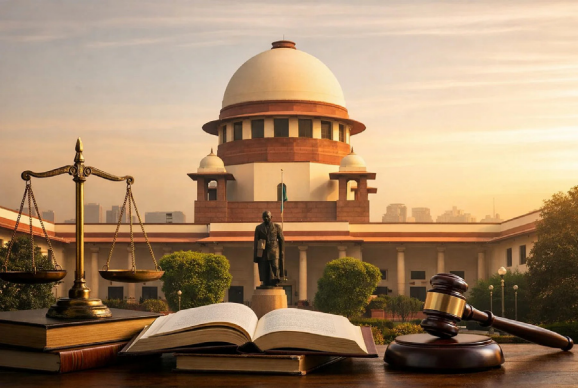
న్యూఢిల్లీ,మే18 :కేబిఆర్ పార్క్ పరిసరాల్లో చెట్ల నరికివేతపై సుప్రీం కోర్టు స్టేషన్ విధించింది. ఎకో సెన్సిటివ్ జోన్ లోపల చెట్లను ఎట్టి