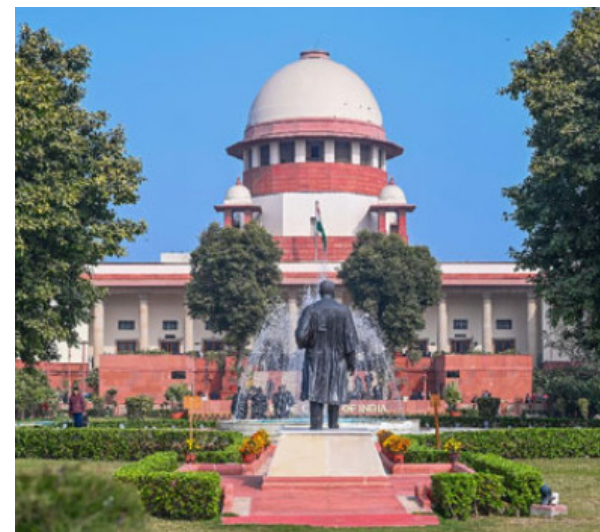
మధ్య ఉన్న నామమాత్రపు గౌరవ వేతనాలు, దక్షిణపై ఆధారపడి జీవిస్తున్నారని, వారికి పెన్షన్, ఆరోగ్య సంరక్షణ వంటి సామాజిక భద్రత కూడా లేదని ఆయన ఆవేదన వ్యక్తం చేశారు.

న్యూఢిల్లీ,మే 18:దేశవ్యాప్తంగా ప్రభుత్వ నియంత్రణలో ఉన్న ఆలయాల్లో పనిచేస్తున్న పూజారులు, సేవార్లు, ఇతర సిబ్బందికి ఏకరీతి వేతనాలు, సంక్షేమ ప్రణాళికను రూపొందించాలని కోరుతూ దాఖలైన ప్రజా ప్రయోజన వ్యాజ్యం (పిల్) విచారణకు సుప్రీంకోర్టు నిరాకరించింది. ఈ విషయంలో తాము జోక్యం చేసుకోలేమని స్పష్టం చేసింది. జస్టిస్ విక్రమ్ నాథ్, జస్టిస్ సంజీవ్ మెహతాలతో కూడిన ధర్మాసనం ఈ మేరకు ఉత్తర్వులు జారీ చేసింది. వివరాల్లోకి వెళితే... న్యాయవాది అశ్వినీ ఉపాధ్యాయ్ ఈ పిల్ దాఖలు చేశారు. ప్రభుత్వ ఆధీనంలోని ఆలయాల్లో పనిచేస్తున్న పూజారులు, సిబ్బంది వేతనాలు, సేవా నిబంధనలను సమీక్షించేందుకు జ్యూడీషియల్ కమిషన్ లేదా నిపుణుల కమిటీని ఏర్పాటు చేయాలని ఆయన తన పిటిషన్లో కోరారు. వేతనాల కోడ్ 2019లోని సెక్షన్ 2(క) ప్రకారం పూజారులను, ఆలయ సిబ్బందిని ‘ఉద్యోగులు’గా గుర్తించి, వారికి కనీస వేతనం, ఇతర కార్యక సంక్షేమ రక్షణలు కల్పించాలని అభ్యర్థించారు. ప్రభుత్వాలు ఆలయాలపై పరిపాలన, ఆర్థిక నియంత్రణ చేపట్టినప్పుడు ప్రభుత్వానికి పూజారుల మధ్య యజమాని-ఉద్యోగి సంబంధం ఏర్పడుతుందని పిటిషనర్ వాదించారు. ఏపీ, తెలంగాణ, తమిళనాడు, కర్ణాటక, కేరళ వంటి రాష్ట్రాల్లో పూజారులు, సిబ్బంది కేవలం రూ. 1,000 నుంచి రూ. 5,000