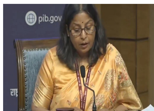
న్యూఢిల్లీ,మే 18:అమెరికా ఆంక్షలు ఉన్నా లేకపోయినా రష్యా నుంచి చమురు కొనుగోళ్లు కొనసాగుతాయని భారత్ స్పష్టం చేసింది. దేశీయ ఇంధన అవసరాలు, ప్రయోజనాలకు అనుగుణంగా ముడి చమురు దిగుమతులు ఉంటాయని తెలిపింది. రష్యా పెట్రోలియం ఉత్పత్తులపై అమెరికా ఆంక్షల మినహాయింపు గడువు ముగిసిన నేపథ్యంలో కేంద్రం

అమెరికా ఆంక్షలు ఉన్నా లేకపోయినా రష్యా నుంచి చమురు కొనుగోళ్లు ఉంటాయని వెల్లడి దేశీయ ప్రయోజనాలకు అనుగుణంగా ముడి చమురు ధరలు ఉంటాయని వెల్లడి ఆంక్షలు అమల్లో ఉన్నప్పుడు కూడా రష్యా నుంచి కొనుగోళ్లు చేశామన్న కేంద్రం